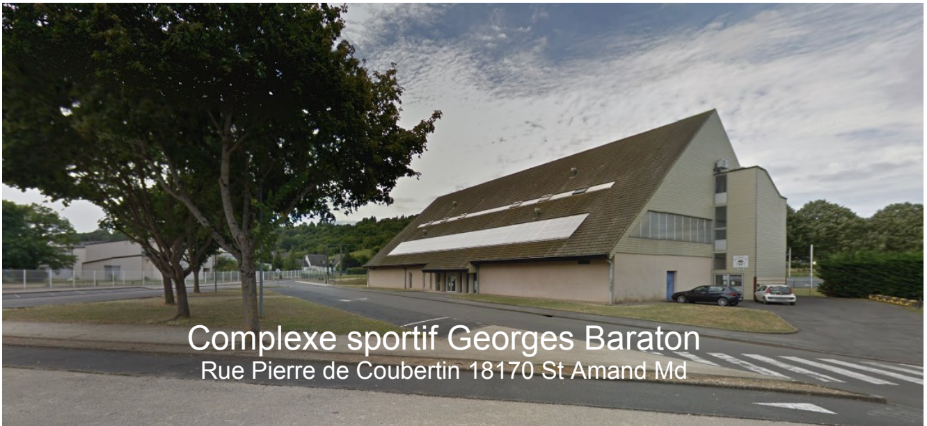
Complexe sportif Georges Baraton Rue Pierre de Coubertin 18170 St Amand Md